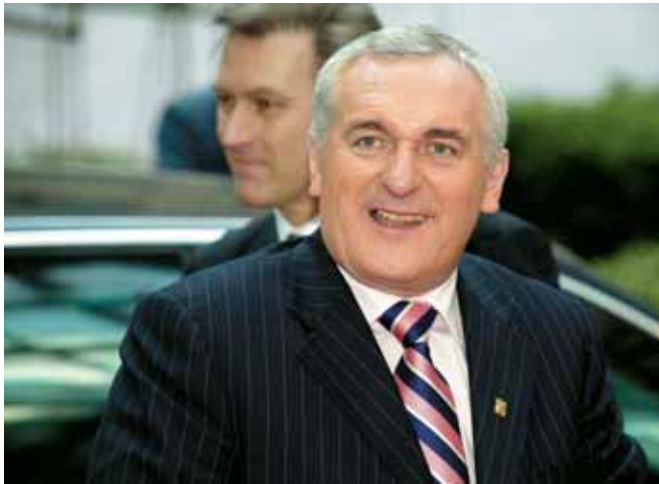
Irlands premiärminister Bertie Ahern

Patricia McKenna är också ordförande i den EU-kritiska organisationen The Peoples Movement , motsvarigheten till Folk-rörelsen Nej till EU i Sverige. The Peoples Movement är motståndare till varje åtgärd som vidareutvecklar EU till en federal superstat och arbetar för att försvara och förstärka nationell su-